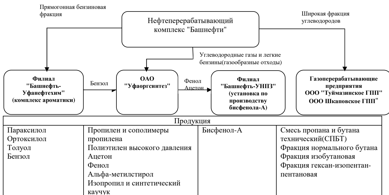
Рисунок 2. Схема производственной кооперации предприятий нефтехимии

Данные предприятия являются частями производственной цепочки единого нефтеперерабатывающего комплекса Группы.